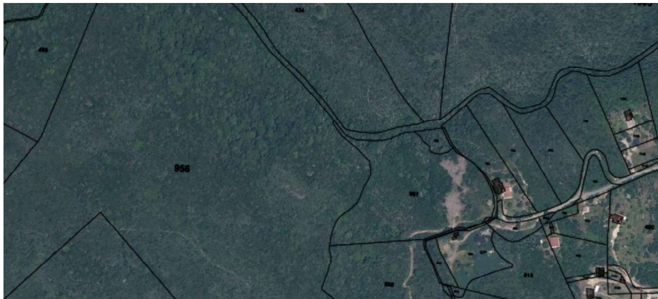
Figure 1 : Emplacement éventuel d'un nouveau réservoir à PIEDICERVU