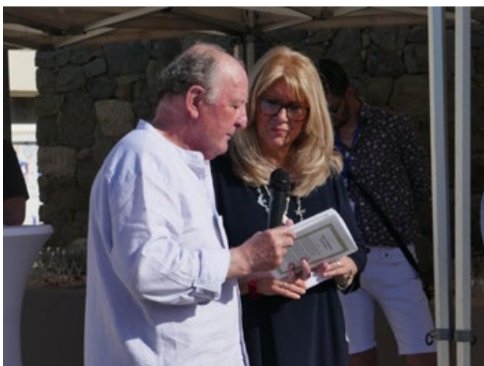
Hommage au peintre Chisa