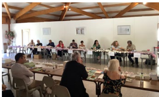
Rencontres à la maison du temps libre de Travu